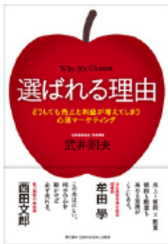
著者:武井 則夫/価格:1,512円(税込み) 出版社:「元氣が出る本」出版部